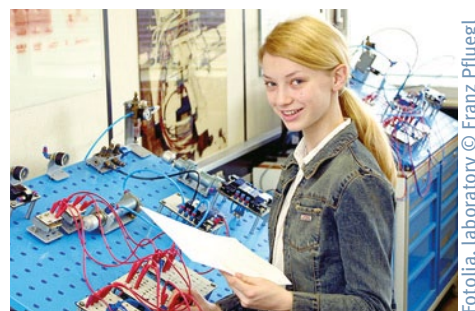
Fotolia, laboratory © Franz Pfluegl

Wir – die junge Deutsche Physikalische Gesellschaft – suchen Schülerinnen und Schüler, die ihre Begeisterung für physikalische Themen weitergeben und dabei erste journalistische Erfahrungen sammeln möchten.